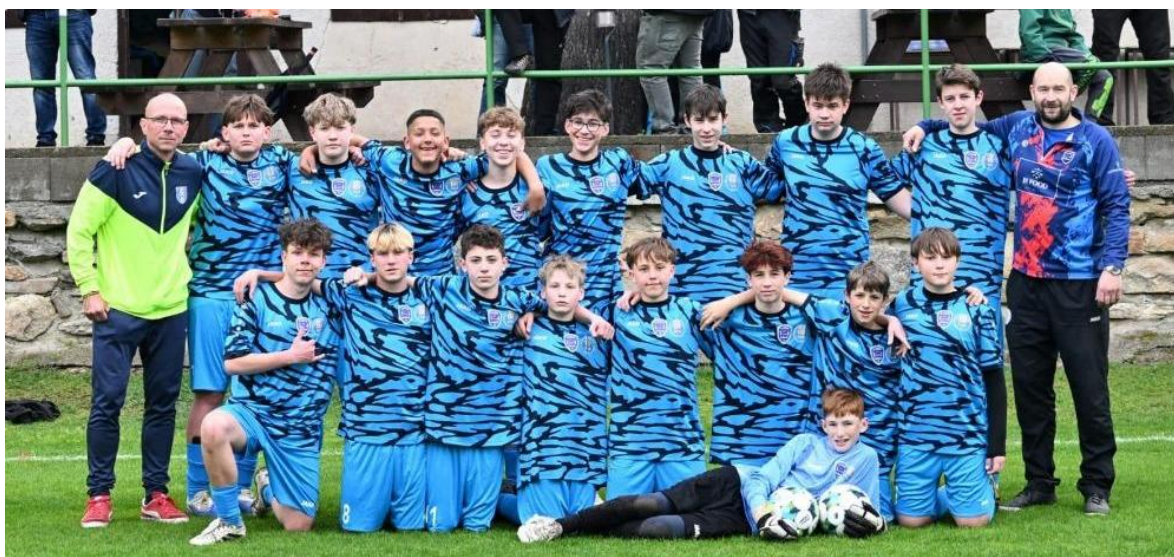
Texty a foto: Vítězslav Kouba

Jarní část fotbalové sezóny ročníku 2025/26 je ve své polovině. Nejlépe si ze Stádlecko-Bechyňských týmů vedou hráči starších žáků. Ti postoupili do skupiny o 1.-10. příčku 1.A třídy a nyní si drží 2. příčku, 5 bodů za týmem Větrov. Mladší žáci ve stejné třídě jsou zatím na 9 místě. Další mladší žáci jsou v okrese Tábor ve středu tabulky, kdy na jaře 4 zápasy vyhráli a 2 prohráli. Do bojů zasáhli i hráči mladší přípravy, kteří na turnajích 4 zápasy vyhráli, 1 remízovali a 3 prohráli. I nadále probíhají každé úterý a pátek tréninky těch nejmenších. Starší dorost srdnatě bojuje v nabitě konkurenci krajského přeboru. Ale bohužel kromě hry řeší i vleklou marodku. Zatím je se 13 body na posledním místě, ale se ztrátou 5 bodů na 9 příčku. O poznání lépe je na tom mladší dorost, který je na 7 místě s 23 body. Muži Sokola na jaře 3 zápasy vyhráli a 1 prohráli, průběžně drží 3 místo, se ztrátou 6 bodů na první FK Meteor C. TJ Sokol Stádlec získal finanční podporu od Nadace České pošty, v programu Poštáči SRDCEM ve výši 10 000,-Kč. Tato částka bude využita na nákup sportovního vybavení. Za podporu děkujeme.